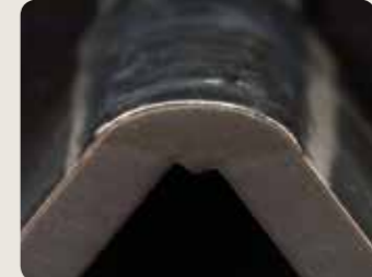
Ein stabiler Lichtbogen sorgt für eine gleichförmige Schweißnaht und ein festes Aneinanderfügen der geschweißten Teile, wodurch wiederum gute mechanische Eigenschaften der Schweißverbindung gewährleistet wird.

Ein größerer Anteil an Wechselstrom führt zu einem besseren Reinigungseffekt, während ein höherer Gleichstrom einen besseren Einbrand gewährleistet.