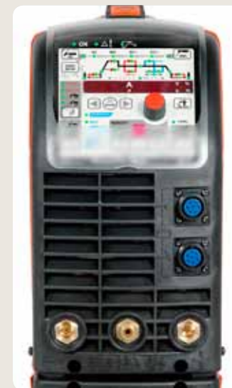
Alle Schweißgeräte der Reihe „MasterTig MLS ACDC“ können mit einem ACX- oder ACS-Bedienpanel ausgestattet werden, an denen zahlreiche nützliche Funktionen für eine angenehmere und effizientere Schweißarbeit ausgeführt werden können.

ACS: Grundfunktionen und MIX TIG ACX: Grundfunktionen, MIX TIG, Speicherkanäle und Sonderfunktionen wie MicroTack, Impulsschweißen, Minilog, 4T LOG