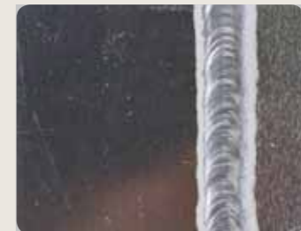
Mit Hilfe der Funktion MIX TIG können die guten Qualitäten von Gleich- und Wechselstrom kombiniert werden. Sie erleichtert das Verschweißen von Aluminiummaterialien und gewährleistet eine Minimierung der Anzahl von Verformungen.