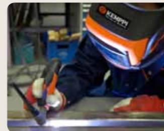
Schweißen mit der Funktion MicroTack führt auf einfache und schnelle Weise zu einer besseren Qualität und Produktivität der Schweißarbeit.